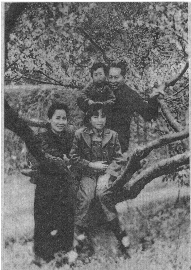
1946年3月，叶挺出狱后和夫人李秀文、女儿叶扬眉、儿子阿九在重庆红岩合影。

叶挺将军的光辉业绩彪炳日月，永载史册。他坚信党的领导、无限忠诚于党、一切服从党指挥的党性原则和组织观念，更值得我们广大党员、干部认真学习。