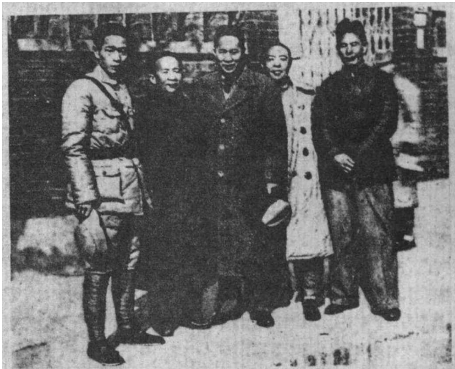
1938年,新四军军长叶挺(左3)、副军长项英(左4)、参谋长张云逸(左2)和副参谋长周子昆(左1)在武汉。

绝,危在旦夕。叶挺决定抓紧突围,以免全军覆没。在干部会上,他心情沉重地说:“你们都是党员,不要忘了入党的誓言。现在局势与我极为不利,你们各自选择突围路线吧,留得火种在,不怕不燎原,即使新四军被消灭了,党还在,党不会忘记我们的……”突围开始,大家劝叶挺先走,叶挺说:“党中央把新四军的担子交给我,阵地上就是剩下一个人,也该是我。”说完就向前沿阵地走去。刚走几步,他又停下,回过头来说:“假如我牺牲了,唯一感到遗憾的就是我脱了党……”说罢,便来到前沿阵地,指挥突围。这时,他致电中共中央,承担责任,表示决心。电报说:“此次失败,挺应负全责……今日事已至此,只好拼一死以赎其过。”