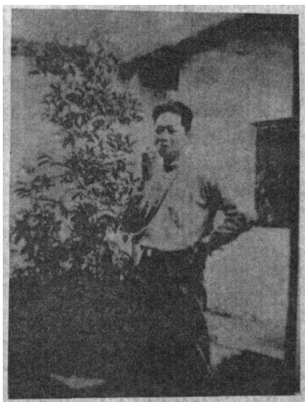
1939年，叶挺军长 在皖南新四军军部。